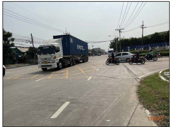
รูปที่ 3.10 บริเวณพื้นที่ถนน ซึ่งมีการสัญจรไป-มาของรถยนต์ บริเวณ สำนักงานโครงการนิคมฯ ปิ่นทองโครงการ 1 (N2)